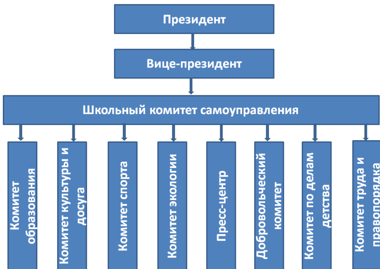
Структура школьного ученического самоуправления «Замандаш»

Основными функциями Президента ШУС «Замандаш» являются: